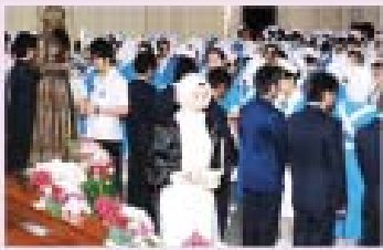
มอบหมวก เข็มเครื่องหมาย และตะเกียงมิสฟลอเรนซ์ในดิงเกล

วทบ.กรุงเทพ ได้จัด “พิธีมอบหมวก เข็มเครื่องหมายและตะเกียงมิสฟลอเรนซ์ในดิงเกล” ให้แก่นักศึกษาพยาบาลศาสตร์ ชั้นปีที่ 1 ห้อง A,B และห้อง C รวมทั้งนักศึกษาจากโครงการผลิตพยาบาลเพิ่มเพื่อแก้ไขปัญหาจังหวัดชายแดนภาคใต้ ทั้งสิ้น 297 คน เพื่อแสดงถึงก้าวแรกของการเข้าสู่วิชาชีพพยาบาล เมื่อวันที่ 28 กุมภาพันธ์ 2551 โดยมีคณาจารย์ ญาตินักศึกษา และนักศึกษารุ่นพี่ มาร่วมแสดงความยินดี สร้างความปลาบปลื้มใจให้นักศึกษาเป็นอย่างยิ่ง