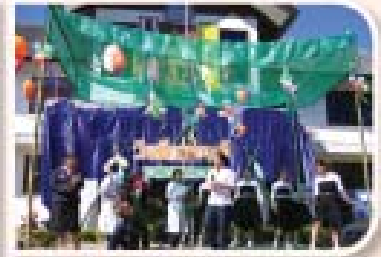
ครั้งที่ 2 วันที่ 12 มกราคม 2551

อาจารย์ บุคลากร สาขาวิชาการพยาบาล และนักศึกษาหลักสูตรพยาบาลศาสตรบัณฑิตชั้นปีที่ 1 และ 3 ออกค่ายอาสา ณ บ้านนาฮ้อย ต.แม่ศึก อ.แม่แจ่ม จ.เชียงใหม่