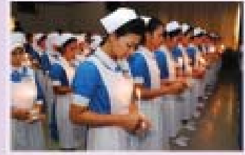
นักศึกษาพยาบาลศาสตร์ ชั้นปีที่ 1 ก้าวแรกของการเข้าสู่วิชาชีพพยาบาล