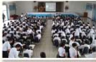
นักศึกษาพยาบาลชั้นปีที่ 1 และปีที่ 4 ให้ความสนใจกว่า 300 คน